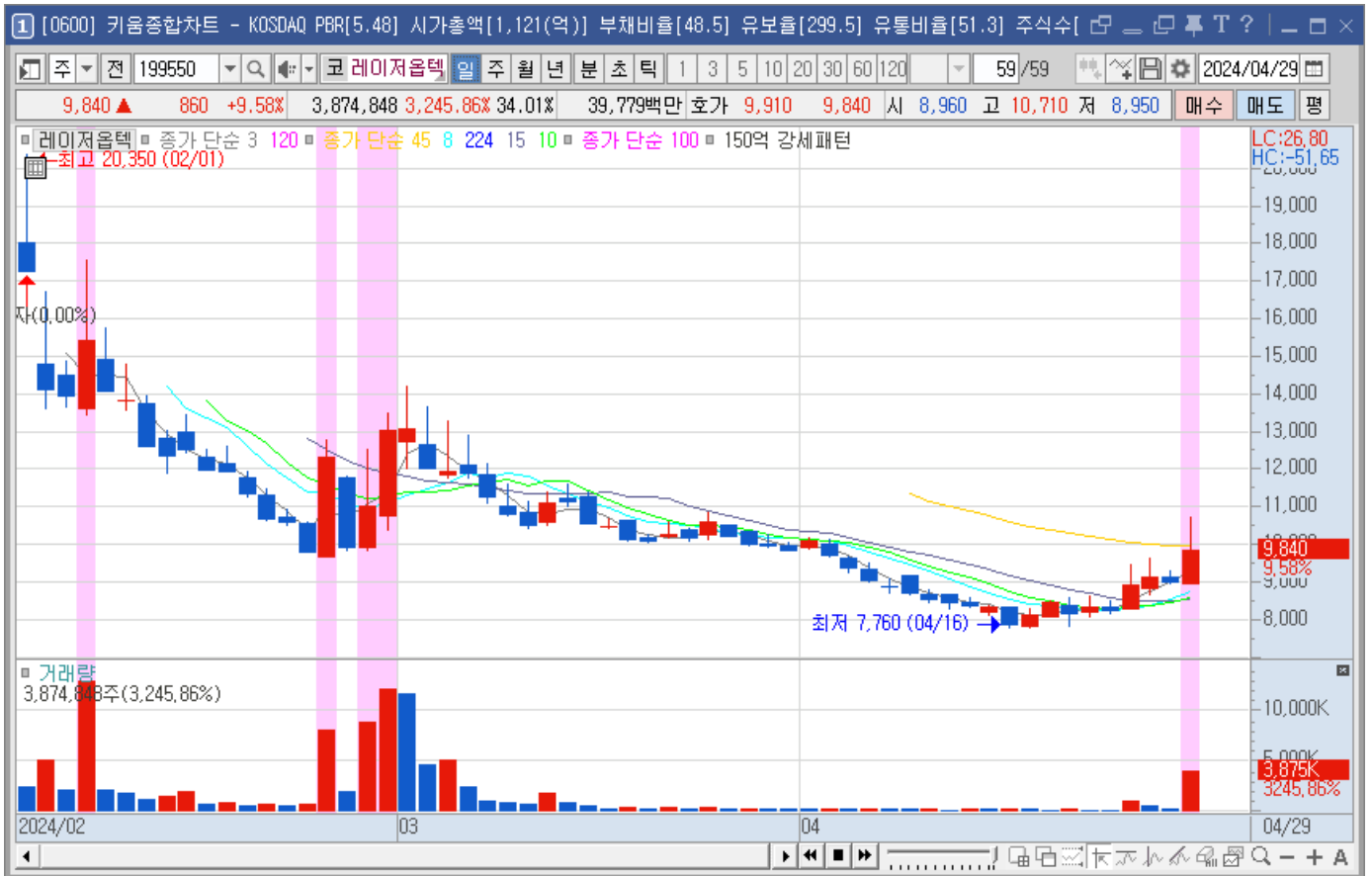
< 1일차 차트 >